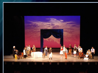
2017.6.4 第5回公演「十二夜」より