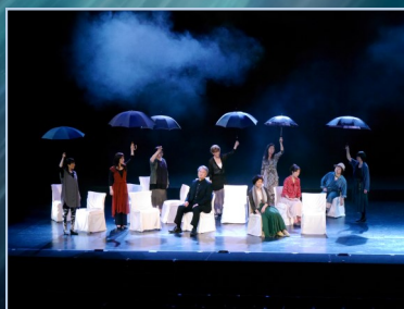
2016.6.4~5 第4回公演「わが町」より 特別出演:女優・吉沢京子(戸田市出身)

劇団ONEは、文化推進プロジェクトの一環として、演劇活動を通じ、団員の親睦と世代間の交流を図り、戸田市における文化芸術の振興と発展に寄与することを目的に戸田市文化会館が設立した劇団です。