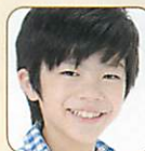
バステイアン 小溝 凧