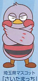
埼玉県マスコット「さいたまっちゃん」