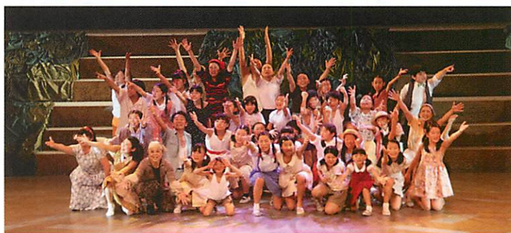
平成23年度「The River～二本の権～2011」より